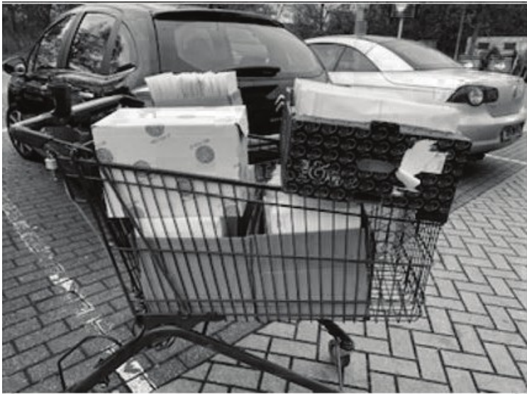
SOK-Mededelingen met kaart als bijlage, klaar voor verzending.

Mail hiervoor de redactie: tbreuls@telenet.be of neem contact op met het SOK-bestuur.